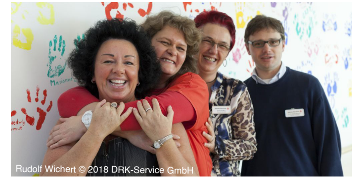
Rudolf Wichert © 2018 DRK-Service GmbH

Diese Kurse sind anerkannt und registriert von der DGP und entsprechen den gesetzlichen Anforderungen (§39a SGB V, §132 i.V., §37b SGB V).