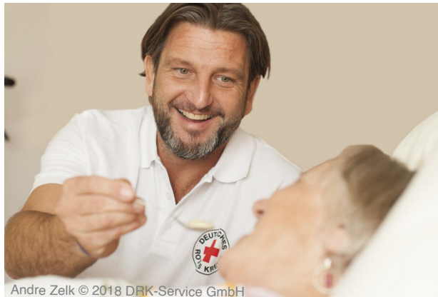
Andre Zeik © 2018 DRK-Service GmbH