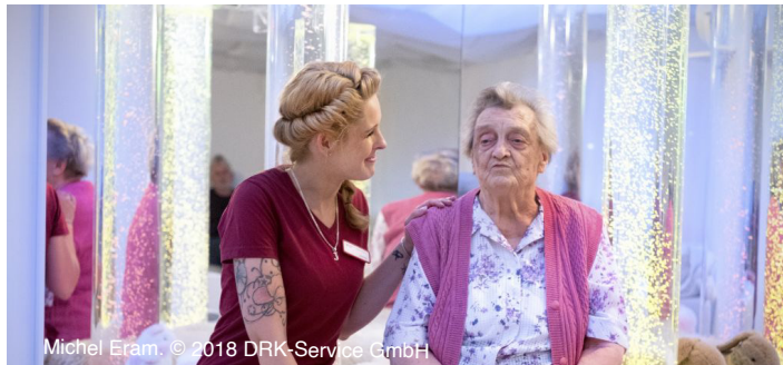
Michel Eram. © 2018 DRK-Service GmbH